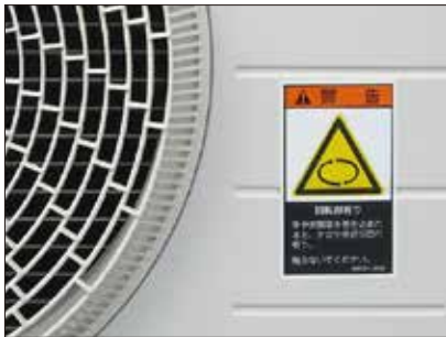
エアコンの室外機