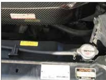
車のエンジン周り

-40℃を超える低温環境にさらされる航空機、車などのエンジン周りには、200℃を超える高熱にさらされます。これらの厳しい環境下で対応できる特殊素材のラベルです。