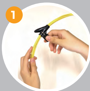
1 電線、配線に挿入工具を取り付ける