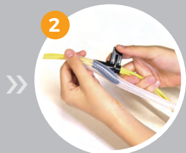
2 チューブの切れ目を挿入工具にかぶせる