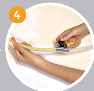
4 チューブの先端をつまんだまま挿入工具をすい〜と滑らせる